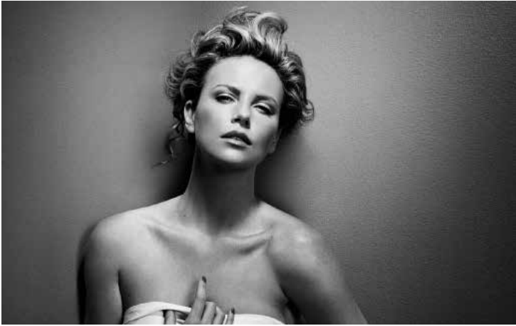
Charlize Theron